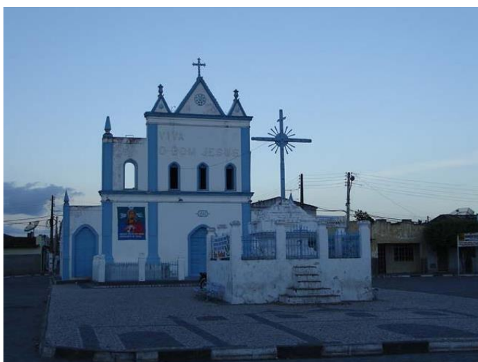
Figura 1 – Igreja do Bom Jesus

Para se chegar de carro à cidade de Crisópolis, saindo de Salvador, são mais de 3h de viagem por estradas simples. Mas vale cada quilômetro percorrido, até chegar ao destino. Pois, o visitante encontrará reunido: Pessoas maravilhosas de cultura tradicional, porém fortes e solidárias, comida deliciosa, tranquilidade e a Igreja do Bom Jesus construída pelo Pelegrino Antônio Conselheiro.